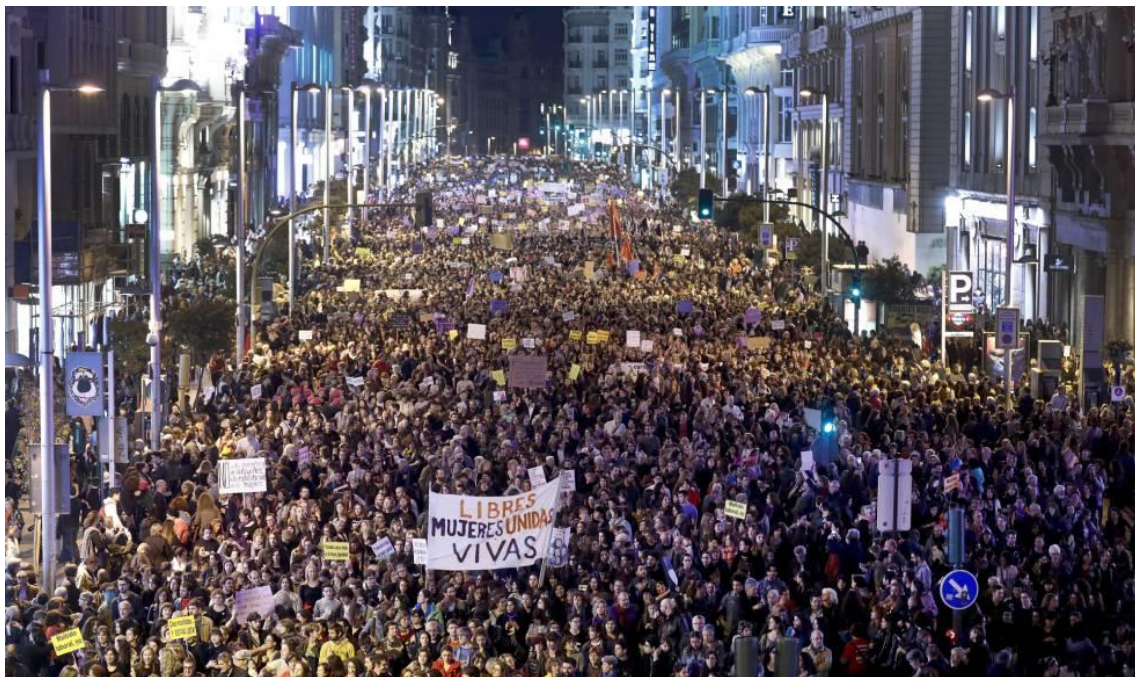
Imagen tomada de:

En paralelo, en el año 2000 la agenda por la paz y la seguridad internacional también iniciaba el proceso de integración de la perspectiva de género a través de la aprobación de la resolución 1325 del Consejo de Seguridad de la ONU. Por primera vez el Consejo de Seguridad de la ONU era escenario de un debate sobre el impacto de los conflictos armados en las mujeres y las niñas y el papel que las mujeres juegan en la construcción de la paz a nivel local e internacional. Comencemos por presentar propuestas que promuevan el enfoque de género en todas sus etapas y para ello debemos desarrollar capacidades personales y colectivas para empoderar mujeres, fortalecer organizaciones para la construcción de mecanismos individuales y colectivos de exigencia al cumplimiento de leyes y programas para prevenir y reducir la violencia basada en género, con el fin de llegar a niveles de tolerancia muy altos frente de la misma, así como para promover acciones basadas en la cultura de paz.